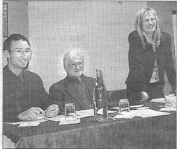
Une femme aux manettes !